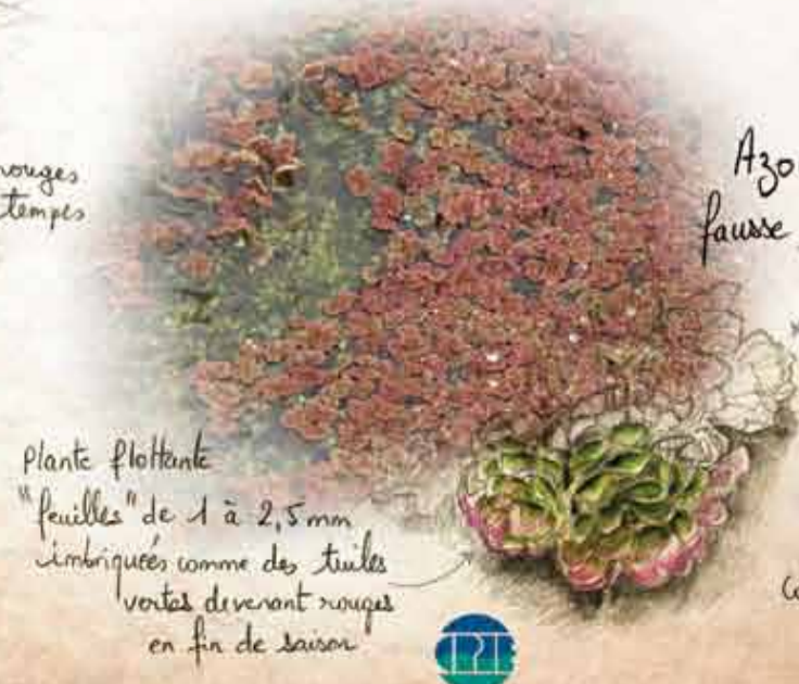
Azolla fausse fougère

Plante flottante "feuilles" de 1 à 2,5 mm imbriquées comme des tuiles vertes devenant rouges en fin de saison