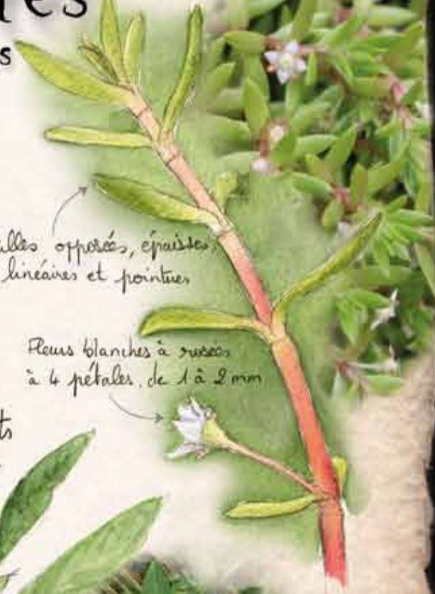
Crossule de Helms

Feuilles opposées, épaisses, linéaires et pointues